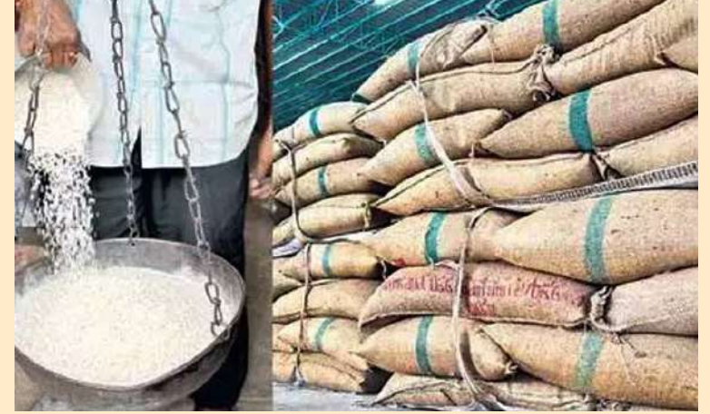
కుంకం నిషా పంచుతాం: షాబాద్ తాసిల్దార్ అన్నం.

రేషన్ డీలర్ల వినియోగదారుల నుంచి బియ్యం కొంటున్నారనే ఆరోపణలపై సివిల్ సప్లై అధికారులు షాపులను తనిఖీ చేస్తున్నారు. రేషన్ డీలర్లపై వినియోగదారుల నుంచి బియ్యం కొంటున్నారనే ఆరోపణలపై సివిల్ సప్లై అధికారులు షాపులను తనిఖీ చేస్తున్నారు. ఒకవేళ రేషన్ బియ్యం అక్రమంగా తరలిస్తూ పట్టుబడ్డ ప్రతినది వ్యాపారులు డీలర్లపై (6) కింద కేసు నమోదు చేసి తీరులు