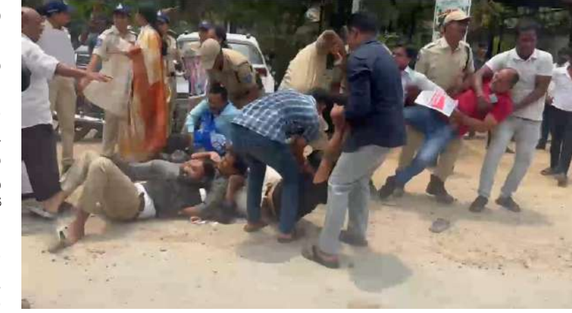
లించారు. మరోవైపు ప్రజాసంఘాలకు చెందిన హాస్ అరెస్టు చేసినట్లు సమాచారం. ఈ ఘటన కొంతమంది నాయకులను ముందుస్తు చర్యగా స్థానికంగా చర్యనియాంశంగా మారింది.

పోలీస్ స్టేషన్ ను ముట్టడించారు. బాధితురాలి కి న్యాయం చేయాలని నినాదాలు చేస్తూ పెద్ద ఎత్తున నిరసన కార్యక్రమం చేపట్టారు. పోలీస్ స్టేషన్ ముందు బయోయించిన ఆందోళనకారులు నిందితుడిపై వెంటనే కేసు నమోదు చేసి కఠిన చర్యలు తీసుకోవాలని డిమాండ్ చేశారు. నిరసన మరంత ఉధృతం కావడంతో పోలీసులు వారిని చెదరగొట్టేందుకు ప్రయత్నించగా ఇరువర్గాల మధ్య తోపులాట చోటుచేసుకుంది. దీంతో ప్రాంతంలో కొంతసేపు ఉద్రిక్త పరిస్థితులు నెలకొన్నాయి. శాంతిభద్రతలకు విఘాతం కలగకుండా పోలీసులు భారీ బందోబస్తు ఏర్పాటు చేసి నిరసనలో పాల్గొన్న పలువురు వివిధ సంఘాల నాయకులను, కార్యకర్తలను అదుపులోకి తీసుకుని పోలీస్ వాహనాల్లో తర