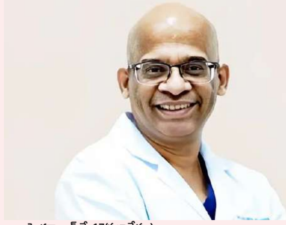
హైదరాబాద్ మే 17(వజ్రక్షేత్రం):