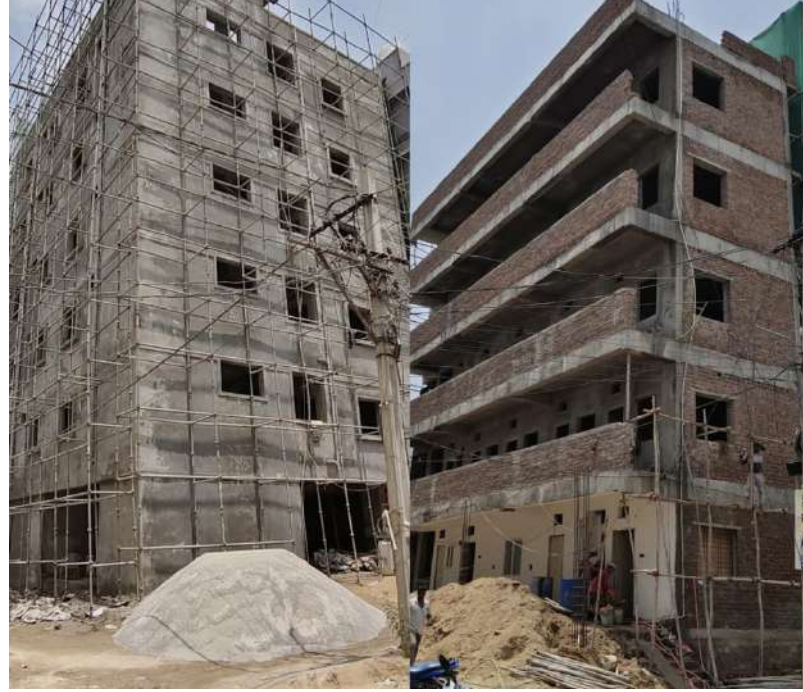
అయితే అక్రమాల ఆపేది ఎవరు..? దుండిగల్ టౌన్ ప్లానింగ్ విభాగానికి సరైన కూల్చివేత పరికరాలు లేకపోవడంతో పూర్తి స్థాయిలో చర్యలు తీసుకోలేకపోతున్నామని సమాచారం వినిపిస్తోంది. అయితే ఇదే కారణంగా అక్రమ నిర్మాణాలకు పరోక్ష ప్రోత్సాహం లభిస్తోందని ప్రజలు ఆవేదన వ్యక్తం చేస్తున్నారు. అధికారుల సైలెన్స్ పెరుగుతున్నా మాన మర్ణతా...? అక్రమ నిర్మాణాలు రోజురోజుకూ పెరుగుతుండగా సంబంధిత అధికారులు మాత్రం స్పందించకపోవడం వెనుక కారణాలేమిటని స్థానికులు ప్రశ్నిస్తున్నారు. ఇప్పటికైనా ఉన్నతాధికారులు ప్రత్యేక దృష్టి సారించి అక్రమ నిర్మాణాలపై కఠిన చర్యలు తీసుకోవాలని ప్రజలు డిమాండ్ చేస్తున్నారు.

నసాగుతున్నప్పటికీ అధికార యంత్రాంగం స్పందించకపోవడం పలు అనుమానాలకు తావిస్తోంది. "కూల్చవేతలు చేశాం" అంటున్న అధికారులు... "అదే భవనం మళ్ళీ కడుతున్నాడు" అంటున్న ప్రజలు కొత్త డిప్యూటీ కమిషనర్ ఆదేశాల మేరకు ఇటీవల రెండు రోజుల పాటు అక్రమ నిర్మాణాలపై కూల్చివేతలు చేపట్టినట్లు అధికారులు ప్రకటించారు. అయితే ఆ కూల్చివేతలు పూర్తిస్థాయిలో జరగలేదని, కేవలం పేరుకే నిర్వహించారని స్థానికులు విమర్శిస్తున్నారు. "కూల్చివేత జరిగిన 48 గంటల్లోనే మళ్ళీ నిర్మాణ పనులు ప్రారంభమయ్యాయి. అధికారులు నిజంగా కూల్చారా..? లేక మళ్ళీ కట్టుకునేలా మార్గం సుగమం చేశారా..?" అంటూ ప్రజలు ప్రశ్నిస్తున్నారు. పుట్టగొడుగులూ పెరుగుతున్న నిర్మాణాలు కనిపించడంలేదా...? లేక కనిపించనట్టే నటిస్తున్నారా...? డి.పోచంపల్లి 168 సర్వే నెంబర్లో ప్రస్తుతం జీరో పర్మిషన్తో నిర్మాణాలు, నిబంధనలకు విరుద్ధంగా అంతస్తులు, ఎలాంటి సెట్ బ్యాక్లు లేకుండా గోడలు, అనుమతులు లేని కమర్షియల్ నిర్మాణాలు వేగంగా జరుగుతున్నాయని స్థానికులు చెబుతున్నారు. అక్రమ నిర్మాణాలు బహిరంగంగా కొనసాగుతున్నా టౌన్ ప్లానింగ్ అధికారులు మాత్రం స్పందించకపోవడంపై తీవ్ర విమర్శలు వెల్లువెత్తుతున్నాయి. "ఎక్స్ప్లెంట్ లేదు" అంటున్న టౌన్ ప్లానింగ్..!