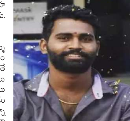
కాగా మృతుడికి భార్య, ఏడాది బాబు ఉన్నారు. ఘటనపై కేసు నమోదు చేసిన మొయినాబాద్ పోలీసులు పోస్టుమార్టం నివేదిక వస్తేనే అసలు నిజాలు తెలుస్తాయని పేర్కొన్నారు.

నించిన ఫామ్ హౌస్ వాచ్ మెన్ వెంటనే నిర్వాహకులకు, పోలీసులకు సమాచారం అందించాడు. హత్యనా? ప్రమాదమా?.. దర్శాపులో పోలీసులు ఘటనా స్థలానికి చేరుకున్న పోలీసులు మృతదేహాన్ని పరిశీలించి పోస్టుమార్టం నిమిత్తం ఉస్మానియా ఆసుపత్రికి తరలించారు. అయితే మృతుడి తల్లిదండ్రులు కుటుంబ సభ్యులు ఘటనా స్థలానికి చేరుకోకముందే పోలీసులు అత్యుత్సాహం ప్రదర్శించి బాడీని తరలించడంపై బంధువులు తీవ్ర ఆగ్రహం వ్యక్తం చేస్తున్నారు. కనీసం కడసారి చూపు కూడా దక్కకుండా ఎందుకు తరలించారని పోలీసులతో వాగ్వాదానికి దిగారు. సాయి మృతిపై తమకు తీవ్ర అనుమానాలు ఉన్నాయని, దీని వెనుక ఏదైనా కుట్ర ఉందేమో తెల్పాలని డిమాండ్ చేస్తున్నారు.