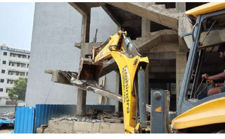
అక్రమ నిర్మాణాలు, రోడ్డు ఆక్రమణలపై